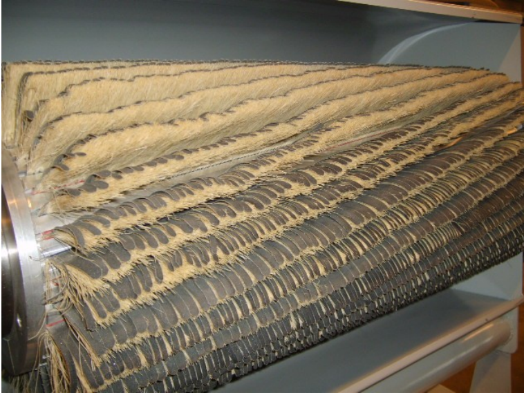
Fladderborstel opgebouwd uit losse strips. Keuze schuurpapier: korrel 60 - 400.